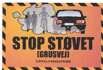
nye forslag til skilte tekster